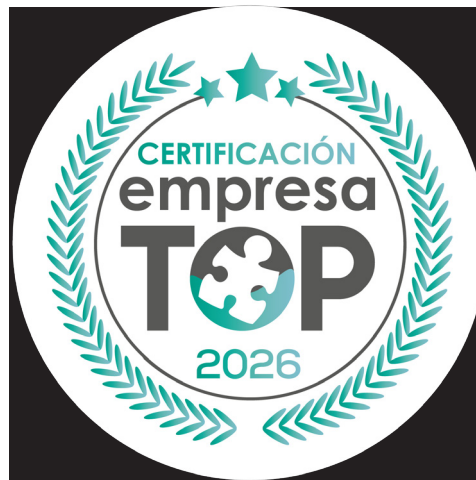
Etiqueta con fondo negro