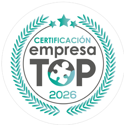
Etiqueta con fondo blanco o color