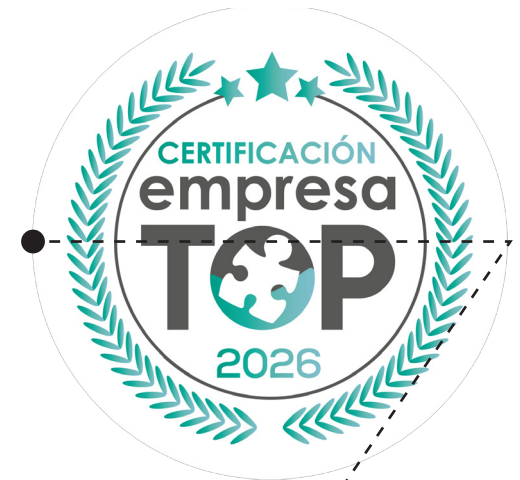
8.5 cm Radio